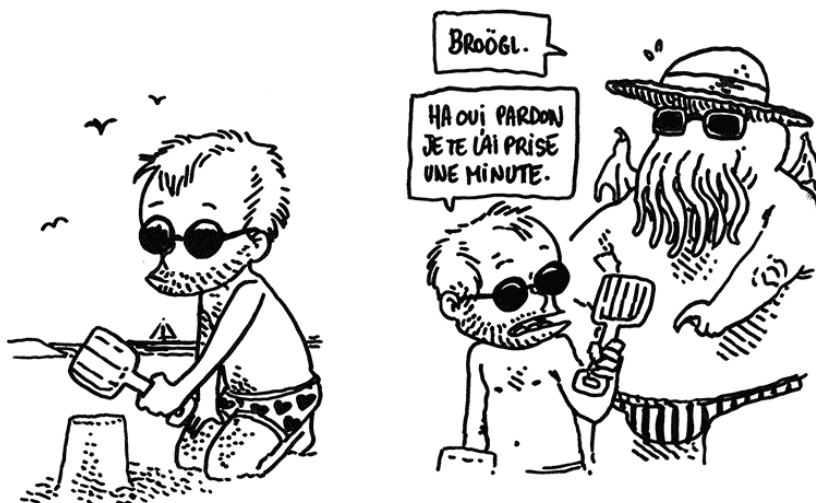
LA PELLE DE CTHULHU.